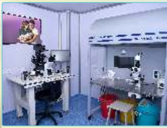
આઈવીએફ પ્રોસિયર રૂમ